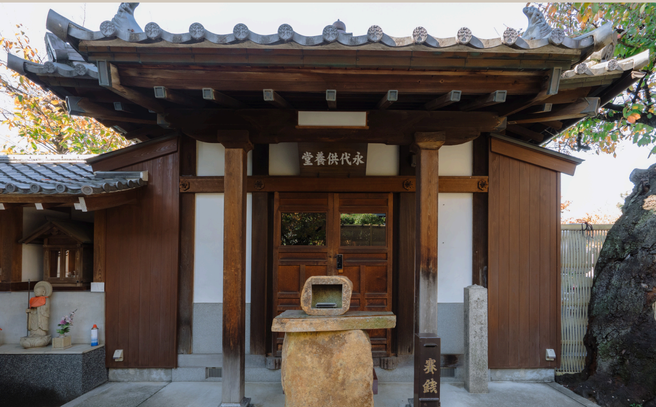
納骨堂（観音堂）正面