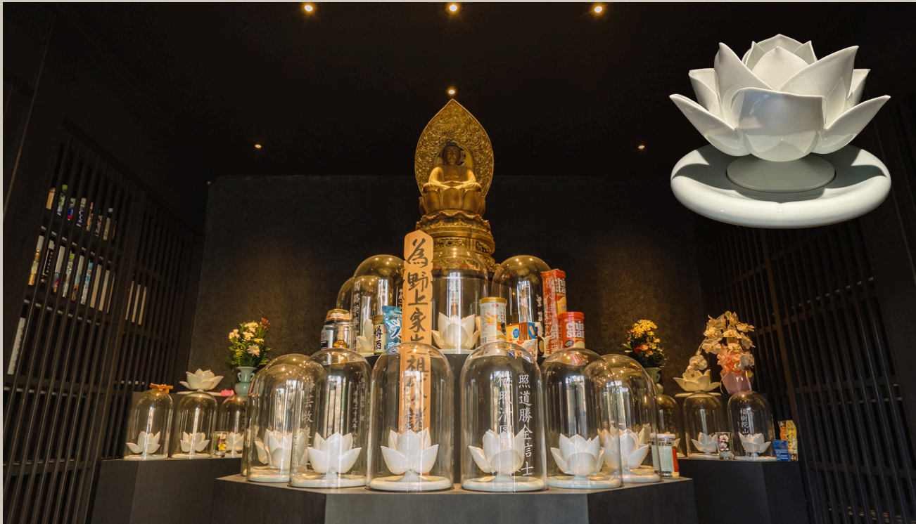
納骨堂（観音堂）室内