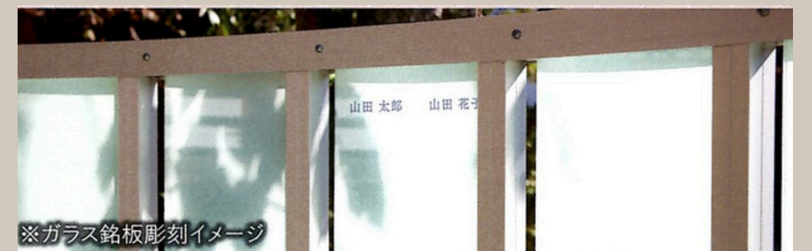
※ガラス銘板彫刻イメージ