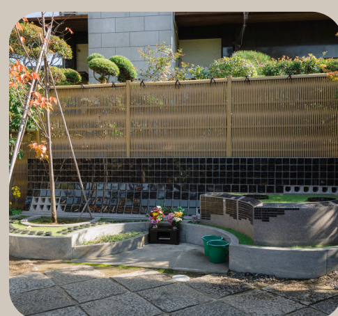
小さなお葬式/樹木葬